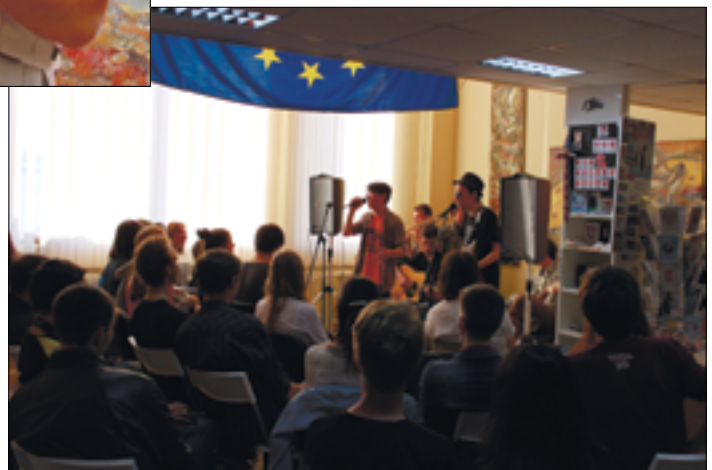
Гурт Czas Lajna