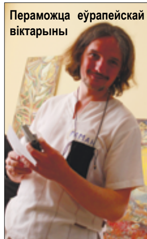
Пераможца еўрапейскай віктарыны