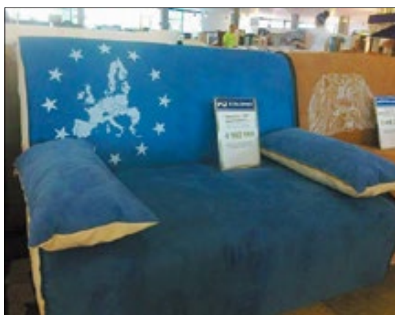
«Эўрапейскага пупсіка» даслала на конкурс Наталька Мотуз