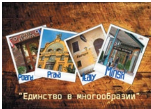
Гэтаму калажу да перамогі не хапіла пары галасоў